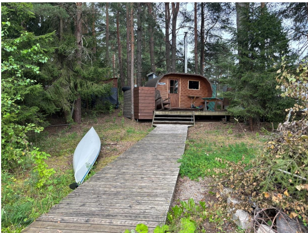
Foto nr 4 Vaade Paunküla veehoidla poolt Hiie kinnistule.