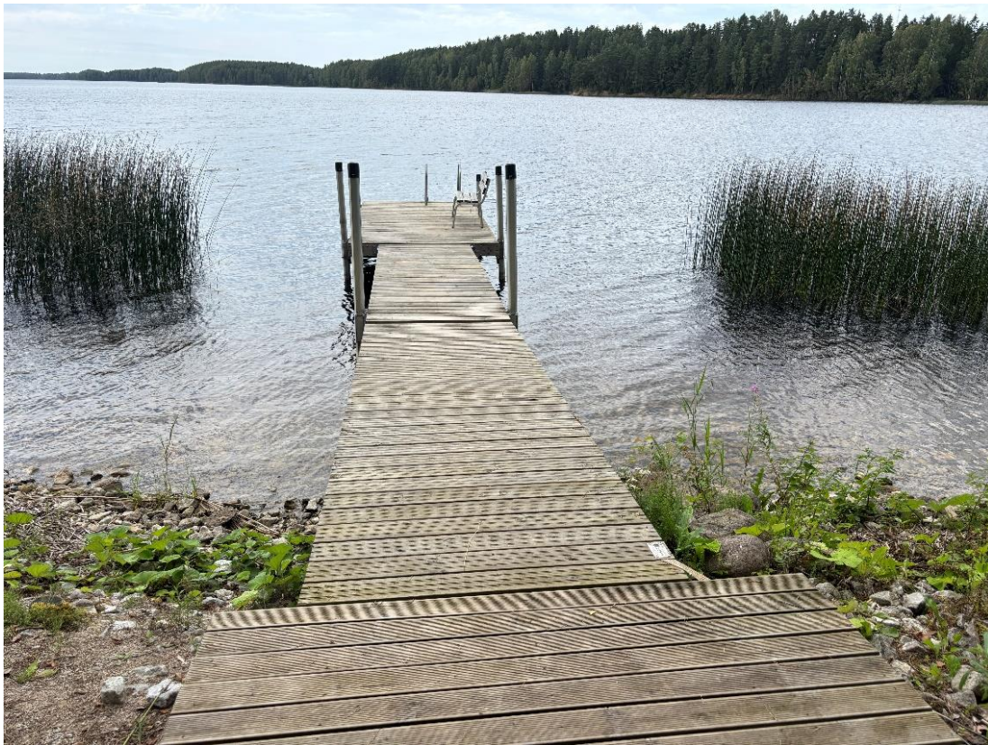
Foto nr 5 Vaade Paunküla veehoidla poole, kus on näha laudtee lõppu ja paadisilda.