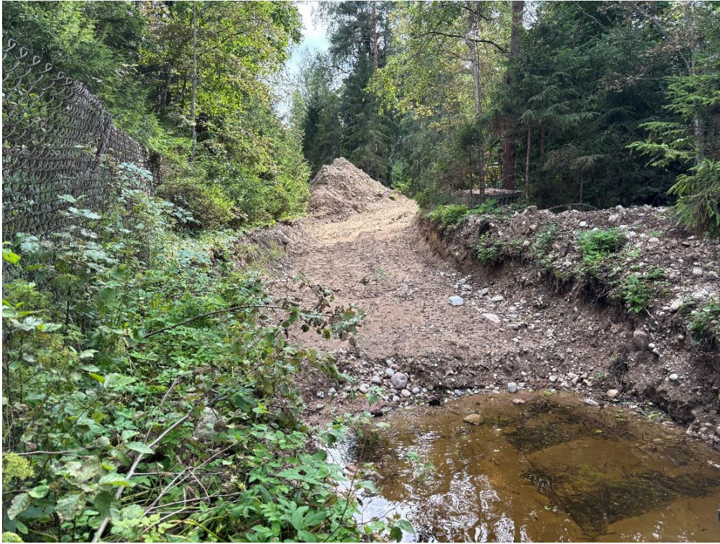
Foto nr 1 Vaade Paunküla veehoidla poolt Veeääre kinnistu poole