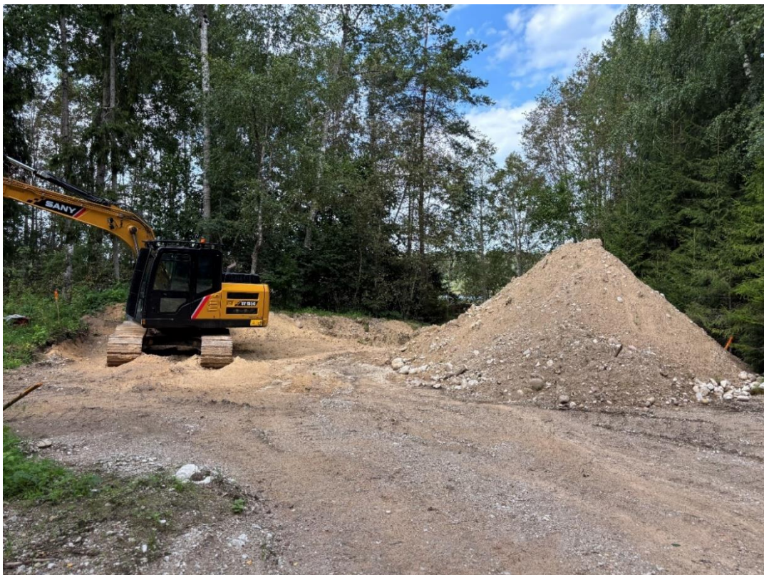
Foto nr 3 Vaade Veeääre kinnistul olemasoleva tee lõpuosale, kruusakoorma tagant algab uus teelõik