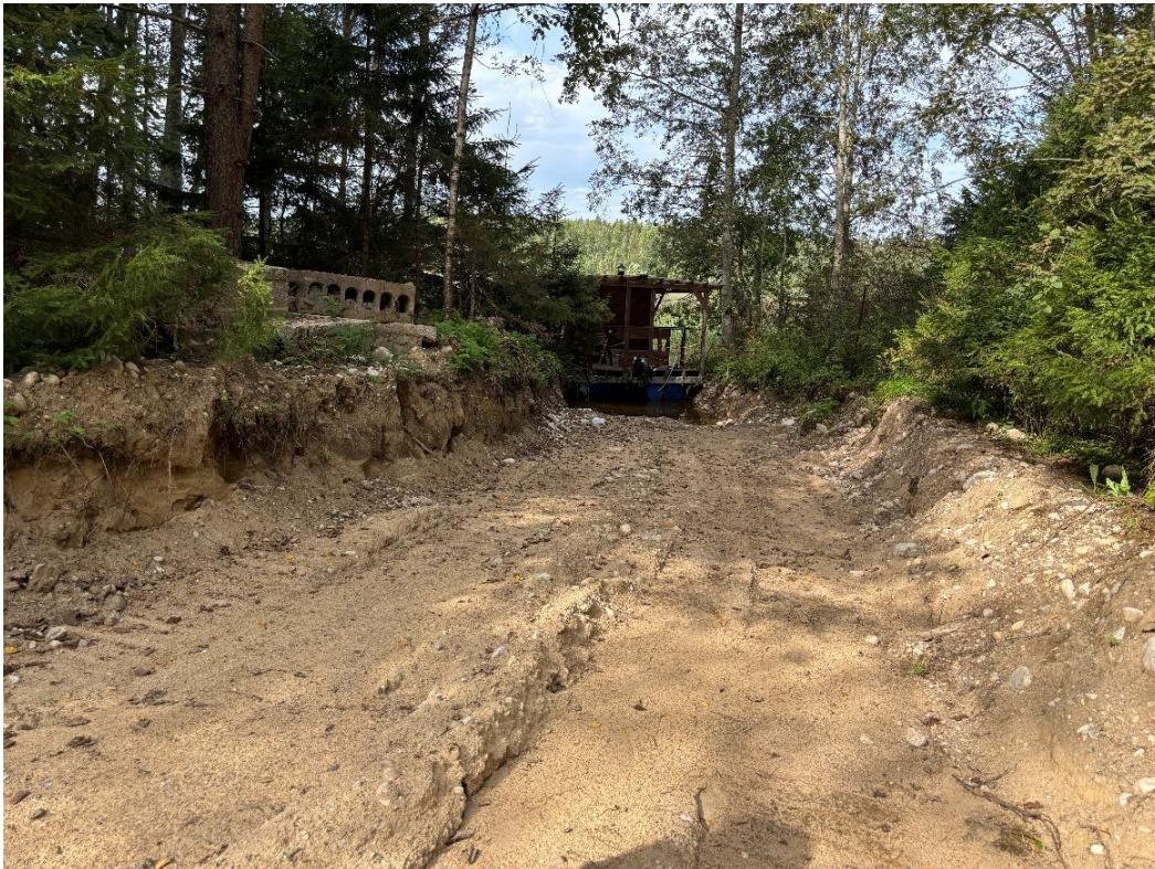
Foto nr 2 Vaade Veeääre kinnistu poolt Paunküla veehoidla poole